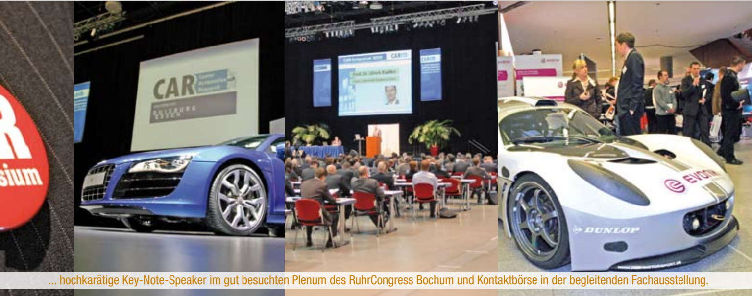
... hochkarätige Key-Note-Speaker im gut besuchten Plenum des RuhrCongress Bochum und Kontaktbörse in der begleitenden Fachausstellung.

vor der Veranstaltung begleichen. Werden die Gebühren nicht innerhalb der Zahlungsfrist beglichen, ist Ihre Teilnahme nicht garantiert. Eine gesonderte Teilnahmebestätigung wird nicht verschickt. Sie erhalten keine Eintrittskarten, sondern bei Registrierung am Tage der Veranstaltung ein Namensschild, das Ihnen die Teilnahme ermöglicht.