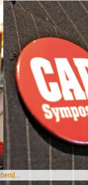
Impressionen des 9. CAR-Symposiums 2009: Get-Together in der VIP-Lounge des rewirpower-Stadions Bochum am Vorabend...