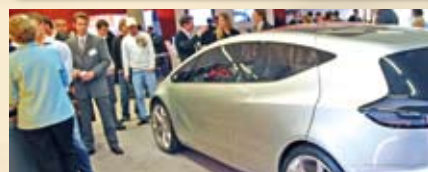
Impressionen Karriere-Tag 2009