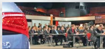
Blick ins Plenum, CAR-Symposium 2009