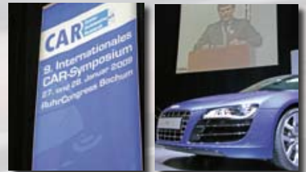
Impressionen CAR-Symposium 2009